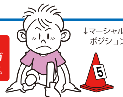
↓マーシャル ポジション