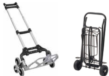
※2輪キャリーカート例