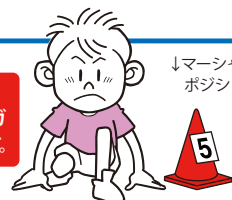
↓マーシャル ポジション