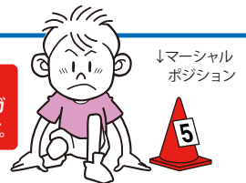
↓マーシャル ポジション